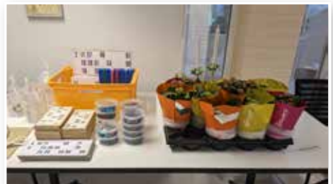
Gevinster til lottospil