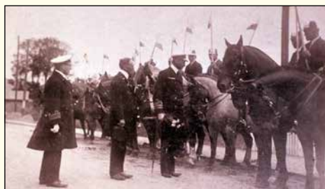
Kongebesøg Chr.X. 1931