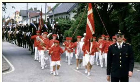
Optog ca. 1990

Som afslutning på denne gode aften sang vi: "Nu er jord og himmel stille!"