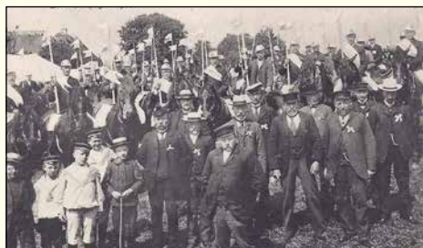
Første ringridning 1904