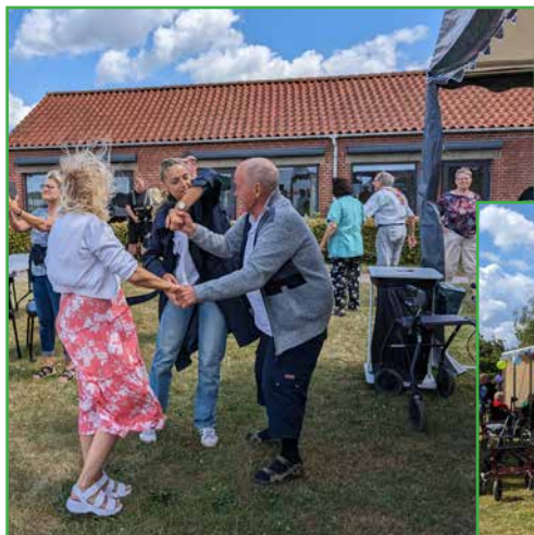
Dansen gik lystigt