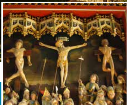
Golthascene fra altertavlens midterste skab ca. 1480. Selve altertavlen består af et midtskab med fire bevægelige fløje.