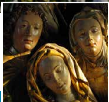
Altertavlens midterfelt med Golgathascene. I nederste venstre hjørne ses Maria, Jesu mor, Maria Magdalene og tre andre kvinder.