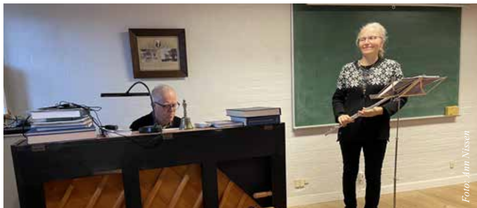
Vores musikalske præstepar spillede på klaver og tværflojte i konfirmandstuen 2. juledag.