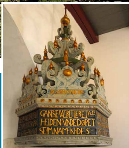
"Fontehimmel" med reliefskåret årstal 1632. Himlen hænger over døbefonten og er smukt dekoreret med bibelske indskrifter om dåben.