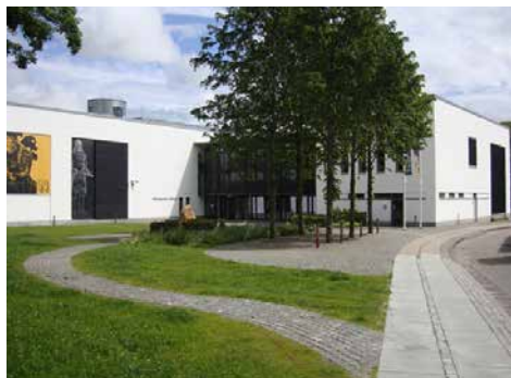
Museet Kongernes Jelling