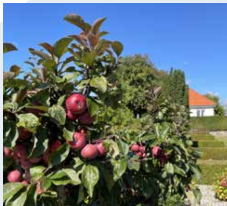
Varnæs kirkegård