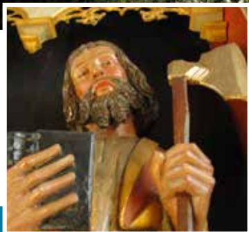
Detalje fra altertavlen med de 12 apostle. Fra begyndelsen af 1500-tallet. Nederst i højre hjørne: S. Mathias